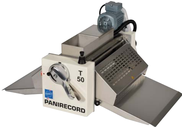
T50 : muy compacta

Disponibile con alimentación monofásica de 230 V, con variador de velocidad