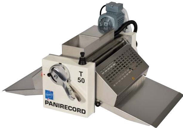
Die T50 : sehr kompakt

Lieferbar auch Einphasig 230V, mit Inverter