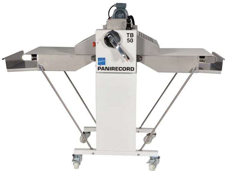
Die TB50 auf Sockel